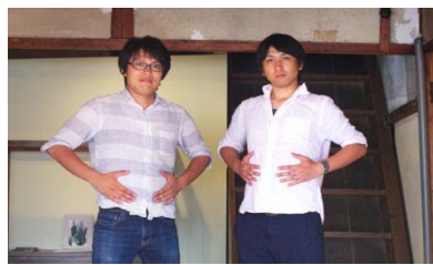
Master Workman _ Art unit olectronica 「美術ユニット」 オレクトロニカ